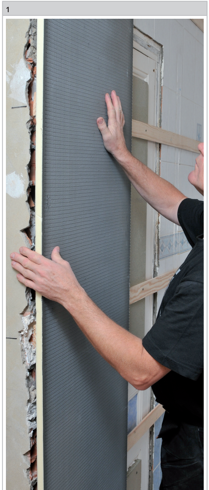
Die Bauplatten lotrecht auf einen Holz- oder Metallrahmen befestigen.

Die Bauplatten können sowohl vertikal wie horizontal verlegt werden. CERMITHANE fortlaufend und über die ganze Breite der Schmalseite auftragen.